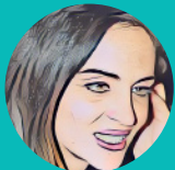
Rosa Nico Apoio Logístico estudante Student Logistic Support Aconselhamento Counselling