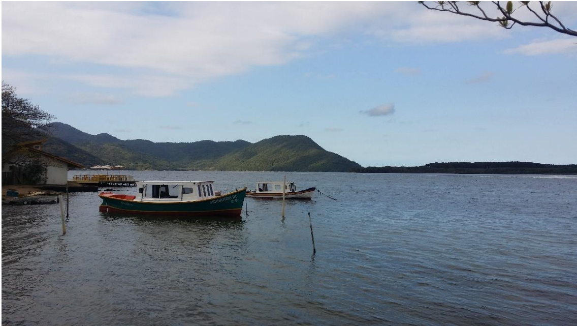
Figura 3- Costa da Lagoa, Vila piscatória Açoriana.

Em relação aos transportes urbanos (autocarros), funcionam bastante bem para toda a ilha, apesar da lotação máxima estipulada, cabe sempre mais 1 ou 30. Em relação aos preços, é bastante económico este meio de transporte, apesar de não ser o preferido dos estudantes e habitantes da ilha de Florianópolis. A famosa boleia “carona” é comum e quase cultural nesta cidade, principalmente para aqueles que se deslocam do Bairro Centrinho da Lagoa da Conceição até à Universidade e vice-versa. Outro ponto menos bom é o facto de chover quase todos os dias, apesar do calor é um lugar onde não se pode confiar nas previsões climáticas.