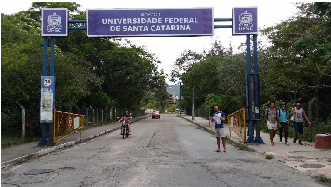
Figura 4- Entrada da Universidade Federal de Santa Catarina.

A Universidade Federal de Santa Catarina (UFSC), é uma instituição de ensino superior pública federal brasileira, sendo a maior universidade do estado de Santa Catarina e uma das melhores Universidades Federais do Brasil.