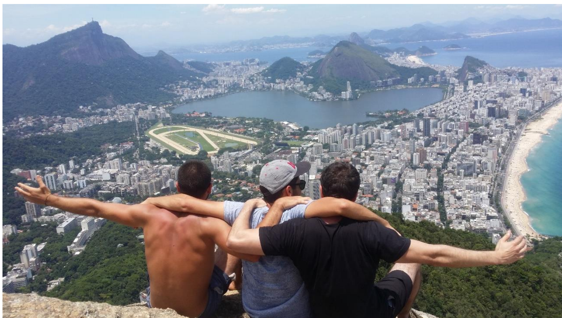
Figura 7- Morro dos dois irmãos, Rio de Janeiro.

Apesar de existirem pontos menos positivos, vejo esta experiência como uma mais-valia a nível pessoal e profissional. Conhecer novas culturas, conhecer outros lugares, sair da zona de conforto faz bem ao corpo e à mente. Uma experiência de vida que todos os alunos do ensino superior deveriam ter a oportunidade de viver, não pensaria duas vezes em repetir (com bolsa mais adequada) seja em Florianópolis ou em qualquer outra cidade.