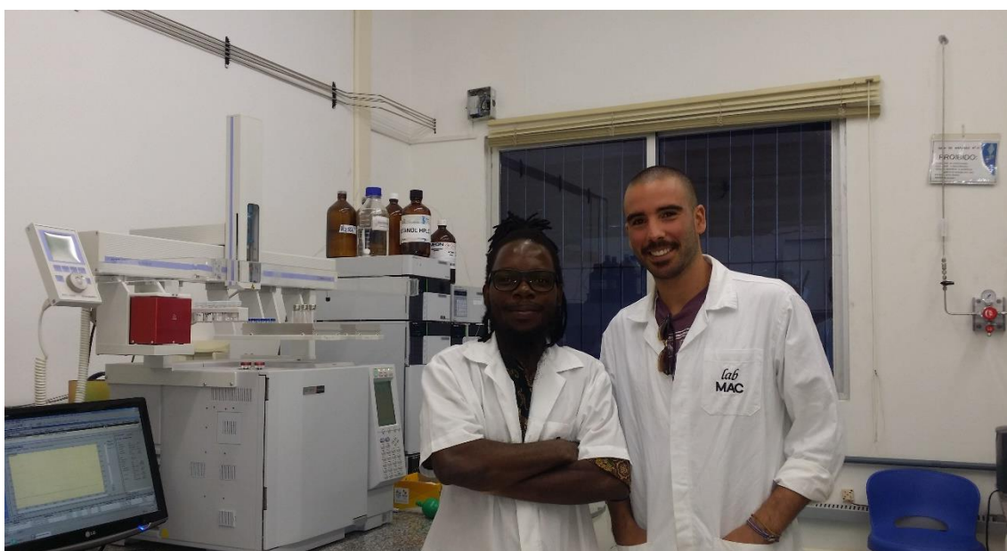
Figura 5- Laboratório de Eng a . Química e dos Alimentos.

O campus da UFSC está situado no bairro da Trindade, a universidade tem instalações muito boas, apesar do polo de Eng a . Química se encontrar um pouco degradado, com algumas salas pequenas para o número de alunos. Não esquecendo de referir, a Biblioteca com excelentes condições e o Refeitório que se encontra aberto todos os dias e com um valor de refeição muito apelativo. Em relação às disciplinas e atividades propostas, o conteúdo das mesmas foi bastante apelativo e uma mais-valia para a minha formação.