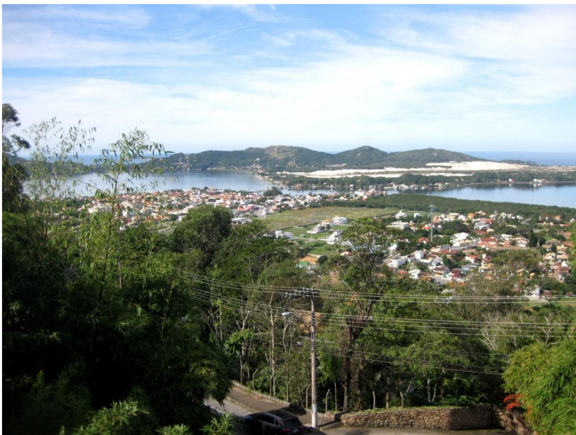
Figura 6- Vista do Bairro da Lagoa da Conceição.

Fiquei alojado num quarto pequeno numa vivenda situada no Centro da Lagoa da Conceição, vivenda essa partilhada com outros 3 estudantes, todos eles de nacionalidades diferentes.