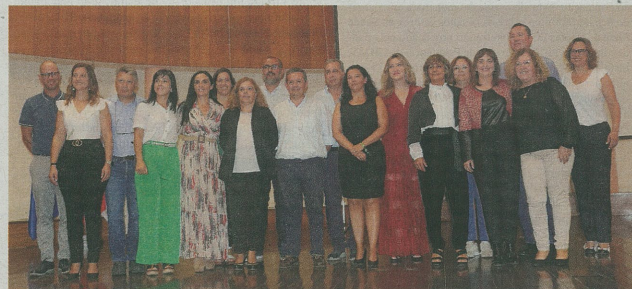
Apresentação formal da equipa da Casa do Pessoal do IPT realizou-se a 8 de setembro