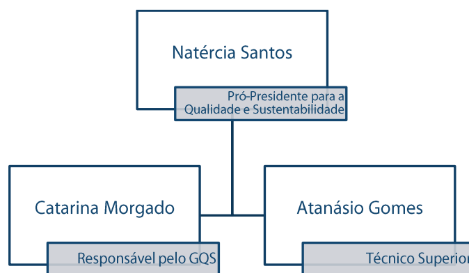
Figura 1: Organograma do Gabinete da Qualidade e Sustentabilidade do IPT

No ano de 2021, o GQS continuará a integrar os 3 grupos de trabalho nomeados pela Presidência: Qualidade, Sustentabilidade e Conciliação. Prevê-se que também possa integrar o Grupo de Trabalho – Diversidade e Inclusão.